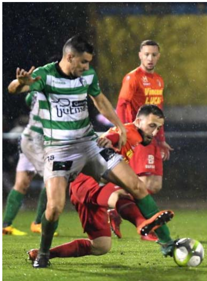
Aucune autre issue que la victoire n'est envisagée à Boussu. © B.L.

ler, aussi. « Nous savons que Tournai vendra chèrement sa peau, mais nous n'avons absolument pas le droit à l'erreur. Echouer une fois de plus si près du but serait une catastrophe ! » La moindre approximation peut foutre toute la saison en l'air, mais les Verts sont prêts à en découdre. « Rentrons dans notre bulle lors des trois semaines qui viennent », poursuit