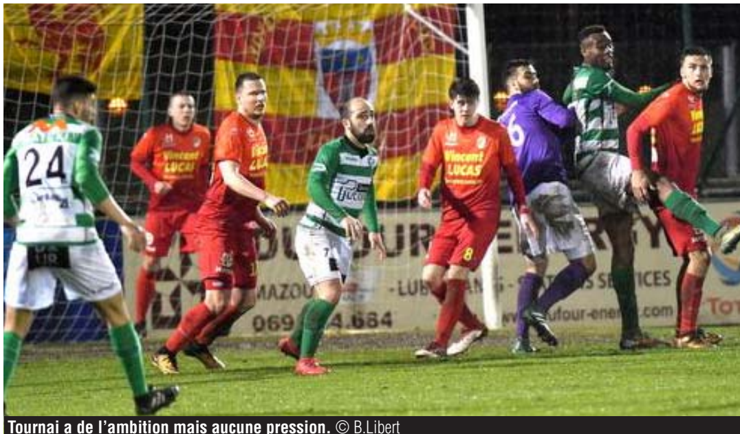
Tournai a de l'ambition mais aucune pression.

Le chemin qui sépare Tournai de la D2 amateurs pourrait être moins long que prévu. La licence de Virton et le tour final de D2 amateurs, où l'URLC, l'Olympic et Liège sont impliqués, pourraient libérer une voire plusieurs places à l'échelon supérieur. Patience... « Nous y verrons bien plus clair la semaine prochaine », confie Dominique Moreau, l'un des dirigeants de l'ACFF. « Tous les cas de figure sont prévus mais effectivement, il se pourrait que le troisième match du tour final de D3 amateurs ne serve à rien. Actuellement, nous sommes tributaires de trop de choses pour établir des prévisions, mais la situation devrait commencer à se décanter dans quelques jours, une fois que Virton sera fixé sur son avenir... » En clair, si la situation vire à la catastrophe pour Virton et/ou que des Wallons montent en D1 amateurs, deux victoires devraient suffire aux participants