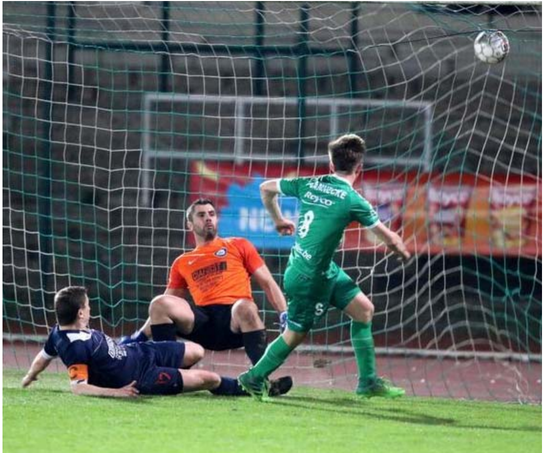
Le médian a inscrit le troisième but louviérois ce week-end.

Il y a quelques jours encore, la RAAL devait viser un sans-faute et espérer un faux pas de son concurrent direct, les Francs Borains. « On s'attendait plus à ce qu'ils perdent des points à Tournai le week-end prochain plutôt qu'à domicile contre Tamines. J'ai suivi le live sur le site du club et, avec mes équipiers, nous échangeons via le groupe que nous avons créé sur Facebook. Honnêtement, une fois que le RFB a pris les commandes à 2-1, nous n'imaginions plus la moindre issue favorable pour nous d'autant que les Namurois étaient réduits à dix. Mais le football a une fois de plus