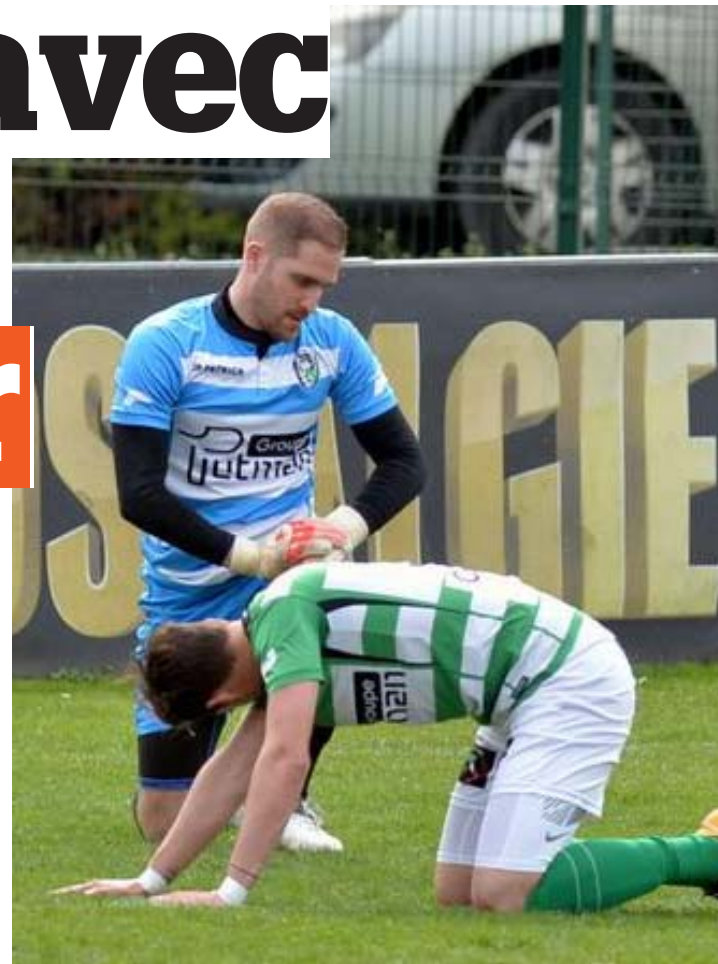
Toute la désolation de Bertrand et Vanderlin.

de réussite, c'est vrai, mais également de jugeote, de ressources mentales et surtout de culot. Et ce n'est pas normal. « En retard sur les seconds ballons, trop loin dans le marquage », poursuit le boss du RFB. « L'entrejeu était aussi trop bas et notre défense incroyablement fébrile, sans raison apparente puisqu'elle avait bien fonctionné les semaines précédentes. Trop de joueurs ont évolué en dessous de leur niveau et les changements n'ont rien apporté. Le penalty gêné ? C'est notre faute et uniquement notre faute. En menant 2-1 en supériorité numérique, un peu d'application et de sérieux nous auraient permis d'aggraver le score. Mais non... » La RAAL, de nouveau maître de son sort, se frotte les mains. « Tout est encore possible et je reste persuadé qu'elle ne remportera pas ses trois rencontres. Dans le foot, quel qu'un qui perd espoir doit arrêter de jouer tout de suite. Par contre, ce match face à Tamines était peut-être l'occasion idéale d'assommer la compétition car une victoire aurait asséné un coup au mo-